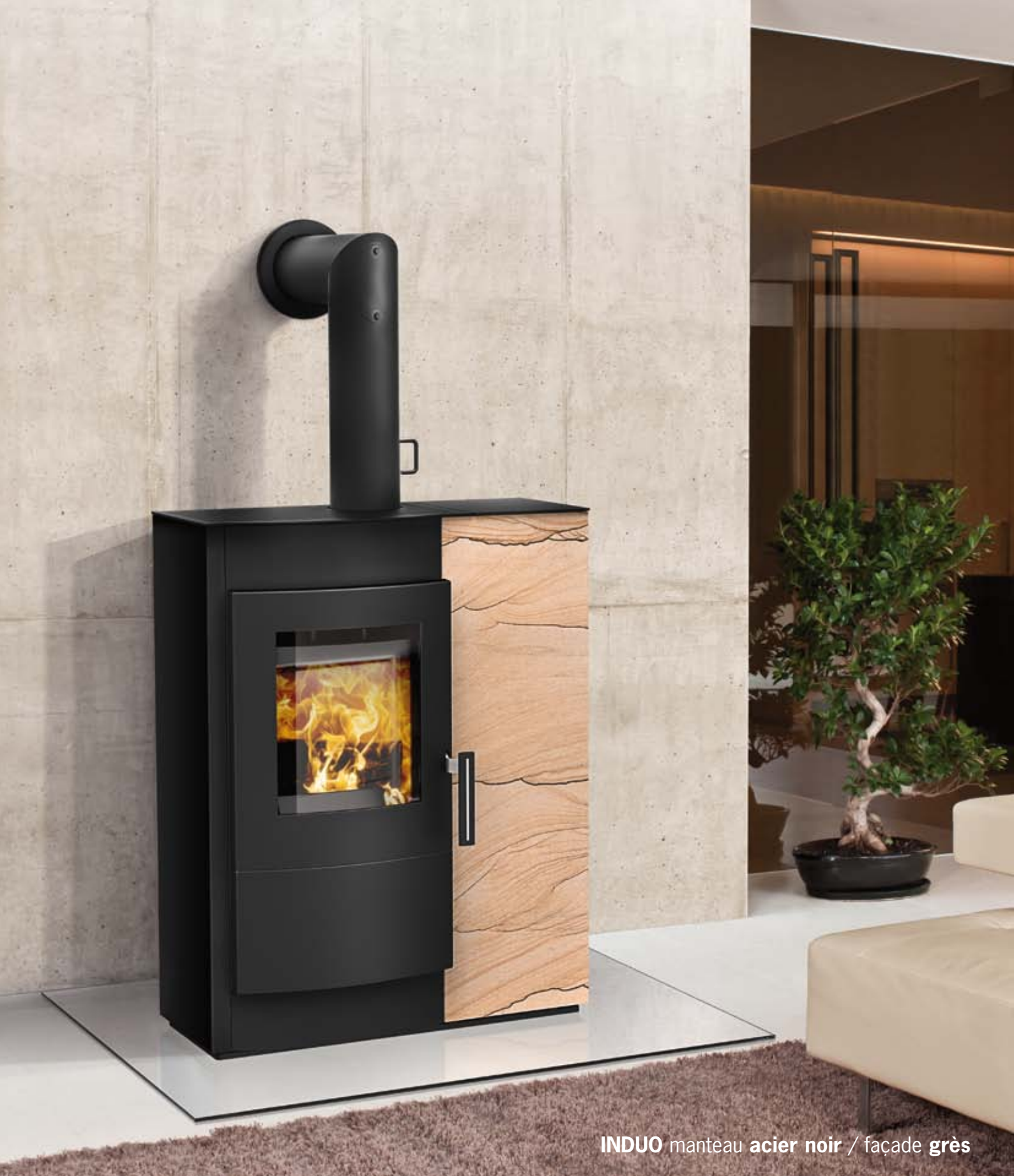
INDUO manteau acier noir / façade grès